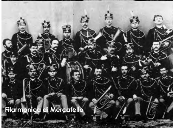
Filarmónica di Mercatello