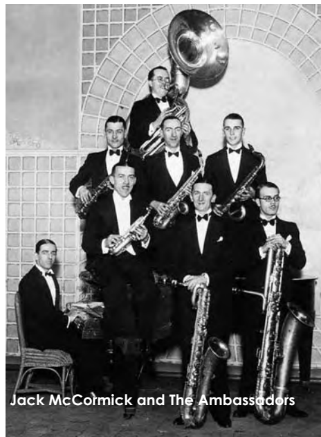
Jack McCormick and The Ambassadors

Parallelamente è diventato strumento solista onnipresente nella musica leggera, dal cantautore alla balera, alimentando sempre più l'immagine un po' stereotipata di strumento lirico, dolce ma anche virile e sensuale.